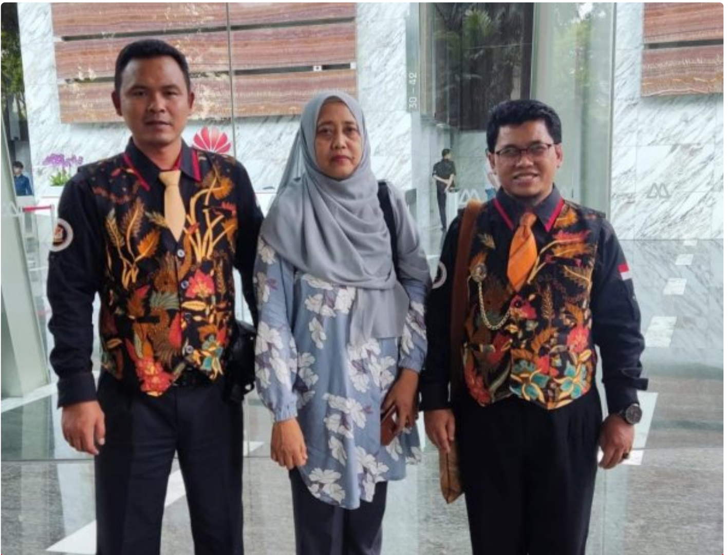
Foto: Tim LIDIK KRIMSUS RI melaporkan dugaan penyimpangan ini ke Komisi Pemberantasan Korupsi (KPK) dan Otoritas Jasa Keuangan (OJK), menuding adanya praktik kotor yang dilakukan oknum PT. Bank Negara Indonesia (Persero) Tbk di Kota Semarang. Senin (04/11/2024).

JAKARTA- Tim Divisi Hukum Lembaga Informasi Data Investigasi Korupsi dan