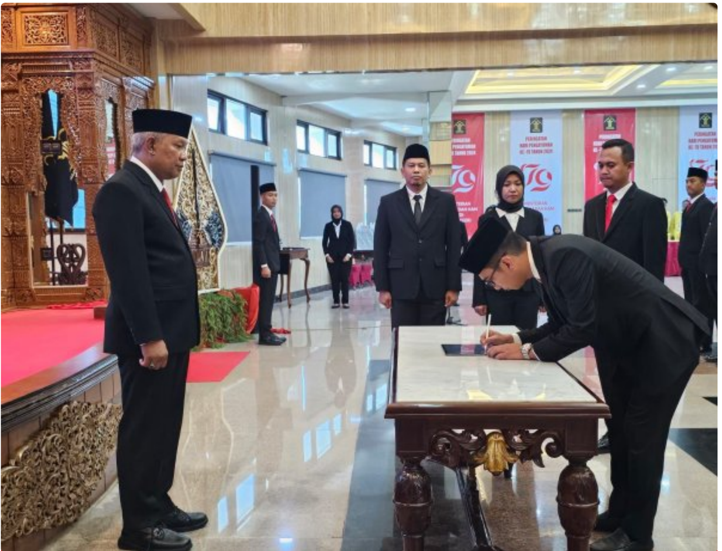
Lantik dan Ambil Sumpah PPNS, MPDN, & Notaris Pengganti, Ini Pesan Penting Kakanwil Kumham Jateng